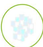
Escamas de PET