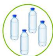
Botellas de PET

La Estrategia Europea de Plásticos para la Economía Circular ( A European Strategy for Plastics in a Circular Economy , COM2018/28) recoge que, todos los envases de plástico en el mercado de la Unión Europea sean reutilizables o reciclables de aquí a 2030. Así, con este valor añadido, los plásticos podrán reutilizarse, recuperarse y reciclarse, gracias al uso de unos materiales más sostenibles con las mismas ventajas.